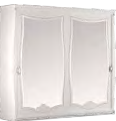
3621 ARMADIO 2 ANTE SCORREVOLI CON CASSETTIERA INTERNA, SPECCHIO ESTERNO E CAPPELLO DRITTO WARDROBE WITH 2-SLIDING DOORS WITH INSIDE DRAWER UNIT, OUTSIDE MIRROR AND STRAIGHT TOP cm 287 x 75 x 255 h.