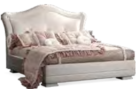
3662 LETTO IN ECOPELLE TANGO 1115 CON TESTATA SAGOMATA E BOTTONI SWAROVSKI COMPLETO DI BOX INTERNO MISURE INTERNE cm 163 x 198 PER RETE cm 160 x 195 STORAGE BED IN TANGO 1115 FAUX LEATHER WITH CONTOURED HEADBOARD AND SWAROVSKI BUTTONS INTERNAL SIZE cm 163 x 198 BASE SIZE cm 160 x 195 cm 190 x 215 x 134 h.