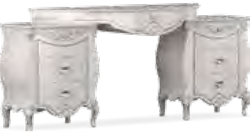
3607 TOILETTE DRESSING TABLE cm 180 x 46 x 77 h.