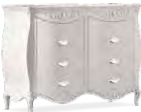
3603 COMÒ 4 CASSETTI 4-DRAWER DRESSER cm 140 x 56 x 105 h.