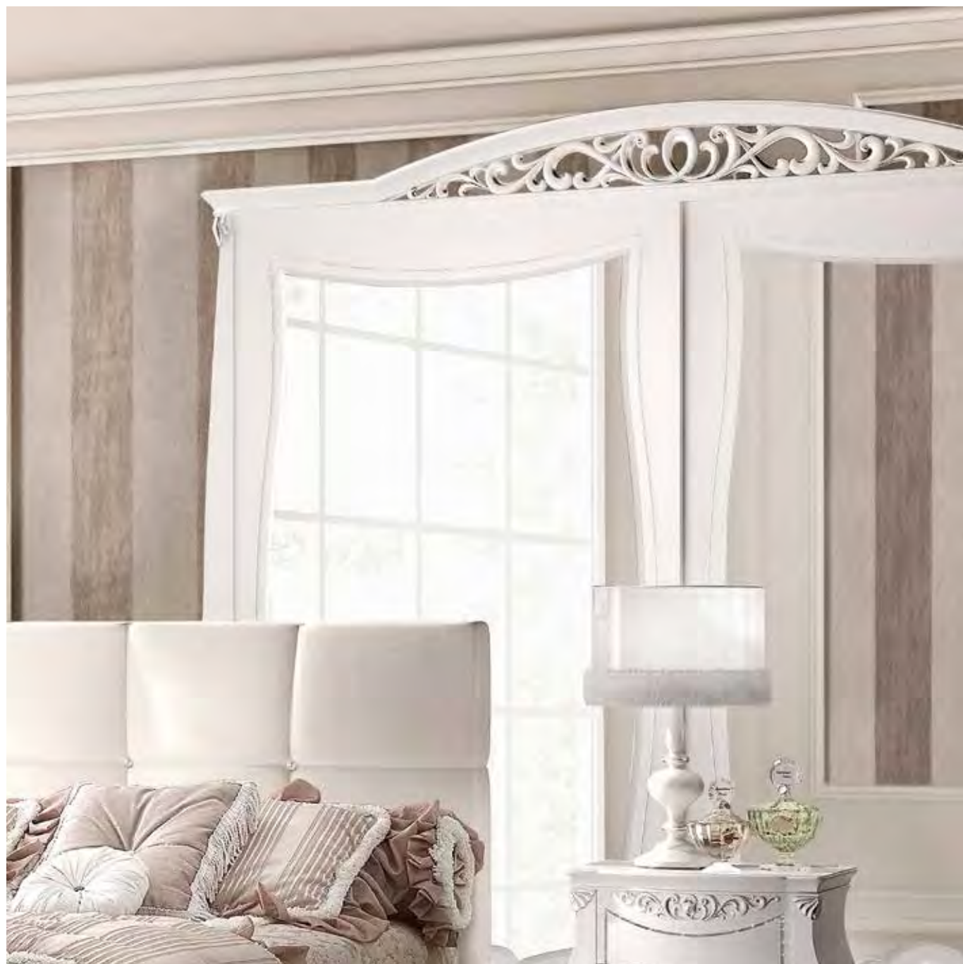
3601 ARMADIO 2 ANTE SCORREVOLI CON CASSETTIERA INTERNA SPECCHIO ESTERNO E CAPPELLO INTAGLIATO E SAGOMATO WARDROBE WITH 2 SLIDING DOORS WITH INSIDE DRAWER UNIT, OUTSIDE MIRROR, AND CARVED CONTOURED TOP cm 287 x 75 x 265 h.