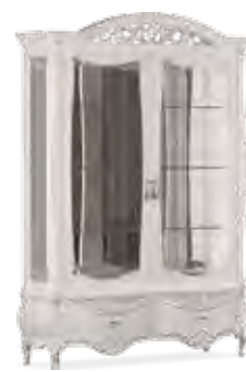
3651 VETRINA 2 ANTE CON FARETTI, SCHIENALE A SPECCHIO E RIPIANI IN CRISTALLO 2-DOOR DISPLAY CABINET WITH SPOTLIGHTS, MIRRORED BACK AND GLASS SHELVES cm 160 x 49 x 227 h.