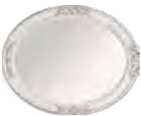
3605 SPECCHIERA OVALE OVAL MIRROR cm 94 x 74