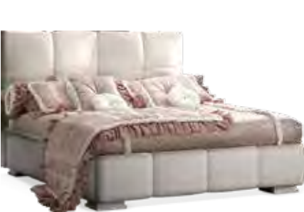
3642 LETTO IN ECOPELLE TANGO 1115 CON TESTATA DRITTA E BOTTONI SWAROVSKI COMPLETO DI BOX INTERNO MISURE INTERNE cm 163 x 198 PER RETE cm 160 x 195 STORAGE BED IN TANGO 1115 FAUX LEATHER WITH STRAIGHT HEADBOARD AND SWAROVSKI BUTTONS INTERNAL SIZE cm 163 x 198 BASE SIZE cm 160 x 195 cm 172 x 215 x 120 h.