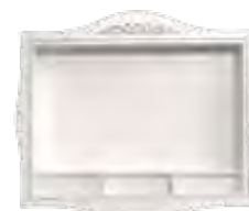
3656 PORTA LCD LCD STAND cm 158 x 24 x 132 h.