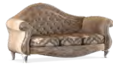
3667 DIVANO 3 POSTI CON TESSUTO "CLG064/03-CLG061/06-CLG060/0" 3-SEATER SOFA WITH FABRIC UPHOLSTERY "CLG064/03-CLG061/06-CLG060/03" cm 280 x 105 x 112 h.