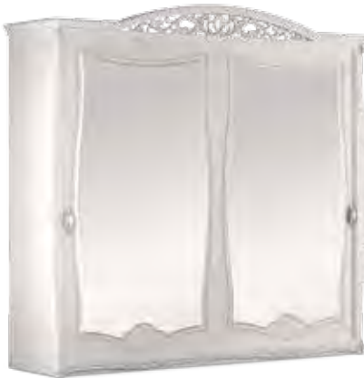
3601 ARMADIO 2 ANTE SCORREVOLI CON CASSETTIERA INTERNA, SPECCHIO ESTERNO E CAPPELLO INTAGLIATO E SAGOMATO WARDROBE WITH 2 SLIDING DOORS WITH INSIDE DRAWER UNIT, OUTSIDE MIRROR, AND CARVED CONTOURED TOP cm 287 x 75 x 265 h.