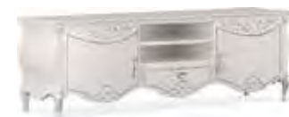
3659 CREDENZA PORTA TV 2 ANTE 2-DOOR TV SIDEBOARD cm 205 x 59 x 65 h.