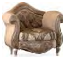
3669 POLTRONA CON TESSUTO "CLG064/03-CLG061/06-CLG060/03" ARMCHAIR WITH FABRIC UPHOLSTERY "CLG064/03-CLG061/06-CLG060/03" cm 108 x 105 x 112 h.