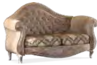
3668 DIVANO 2 POSTI CON TESSUTO "CLG064/03-CLG061/06-CLG060/03" LOVE SEAT WITH FABRIC UPHOLSTERY "CLG064/03-CLG061/06-CLG060/03" cm 225 x 105 x 112 h.