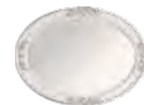
3650 SPECCHIERA OVALE PER CREDENZA OVAL MIRROR FOR SIDEBOARD cm 120 x 90