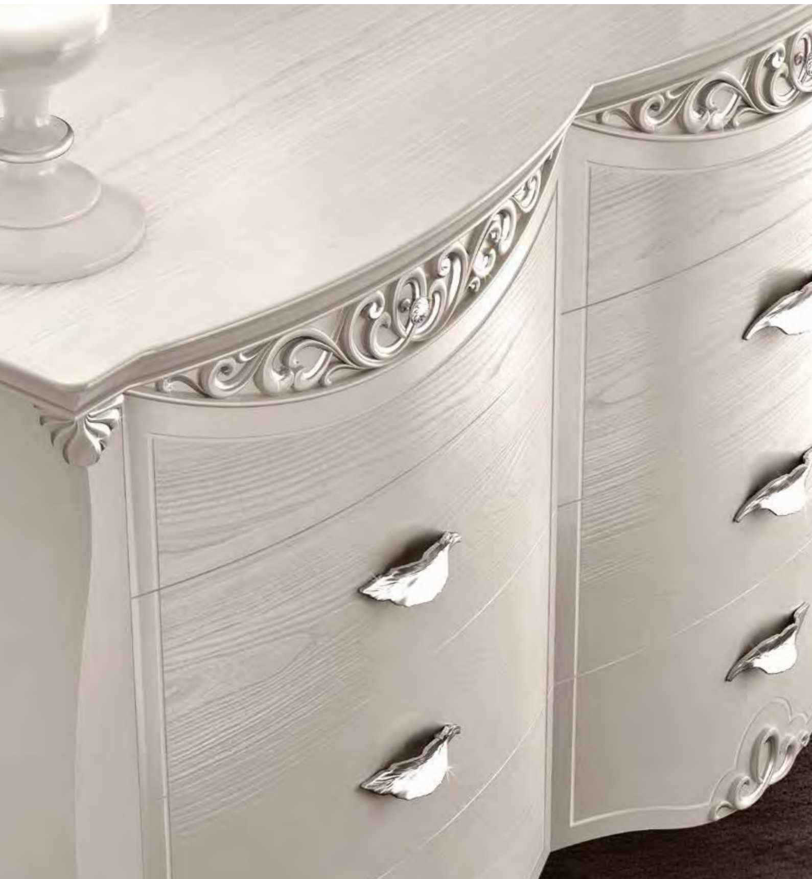
PARTICOLARE COMÒ CON CASSETTI SENZA SWAROVSKI DETAIL OF DRESSER WITHOUT SWAROVSKI