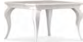
3655 TAVOLO QUADRATO CON ALLUNGO CENTRALE DA 50 CM SQUARE TABLE WITH CENTRAL EXTENSION, 50 cm cm 120/170 x 120 x 78 h.