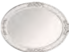
3650 SPECCHIERA OVALE PER TOILETTE OVAL MIRROR FOR DRESSING TABLE cm 120 x 90