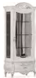
3657 VETRINA 1 ANTA CON FARETTO, SCHIENALE A SPECCHIO E RIPIANI IN CRISTALLO 1-DOOR DISPLAY CABINET WITH SPOTLIGHT, MIRRORED BACK AND GLASS SHELVES cm 90 x 49 x 210 h.