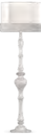
9020 PIANTANA CON PARALUME IN TESSUTO “G028” FLOOR LAMP WITH SHADE IN “G028” FABRIC cm 178 h.