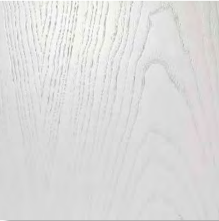
16/A LACCATO BIANCO OPACO