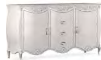
3652 CREDENZA 2 ANTE E 4 CASSETTI CENTRALI 2-DOOR SIDEBOARD AND 4 CENTRAL DRAWERS cm 205 x 59 x 105 h.