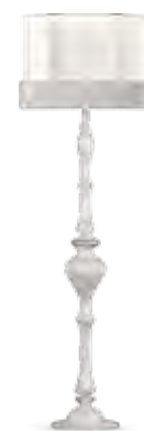
9020 PIANTANA CON PARALUME IN TESSUTO "G028" FLOOR LAMP WITH SHADE IN "G028" FABRIC cm 178 h.