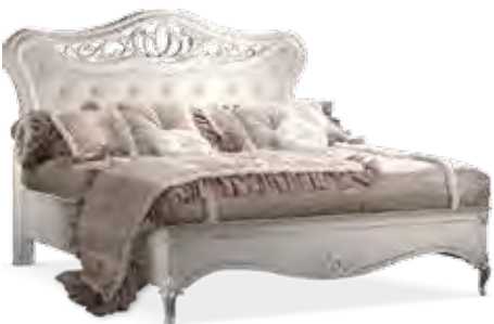
3602 LETTO CON GIROLETTO E TESTATA CAPITONNÉ IN ECOPELLE TANGO 1124 MISURE INTERNE cm 163 x 193 PER RETE cm 160 x 190 BED WITH SURROUND AND TUFTED HEADBOARD IN TANGO 1124 FAUX LEATHER INTERNAL SIZE cm 163 x 193 BASE SIZE cm 160 x 190 cm 187 x 208 x 142 h.