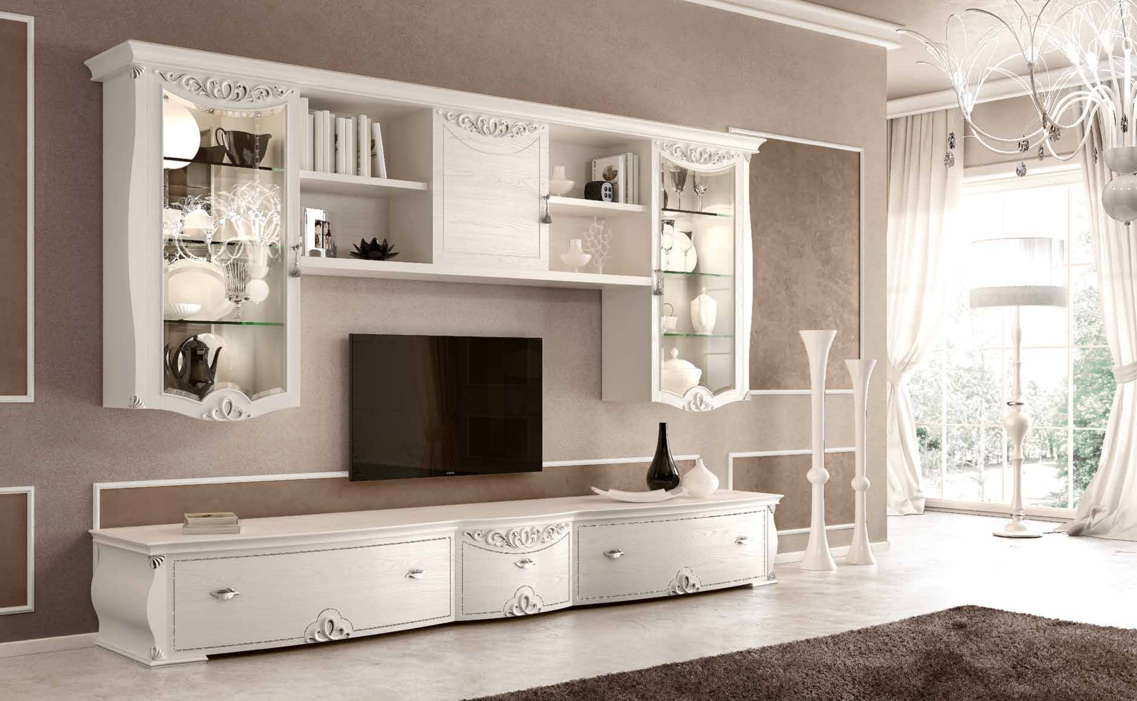
COMPOSIZIONE "1" CON FARETTO INTERNO PENSILE VETRINA COMPOSITION "1" WITH SPOTLIGHT INSIDE HANGING DISPLAY CASE cm 323 x 39/69 x 215 h.