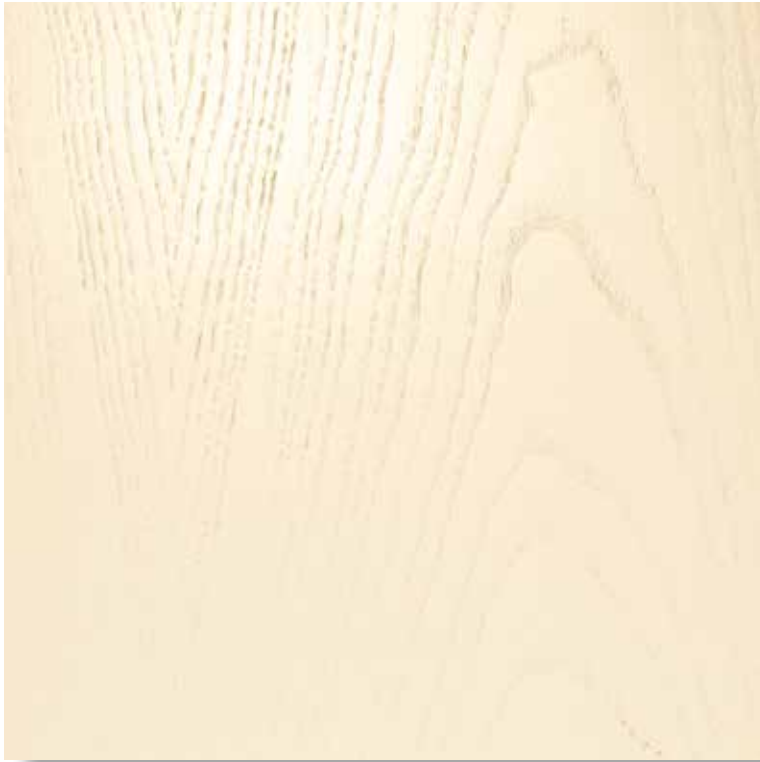
16/M LACCATO AVORIO