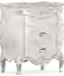
3604 COMODINO 3 CASSETTI 3-DRAWER NIGHTSTAND cm 56 x 39 x 68 h.