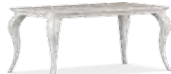
3653 TAVOLO RETTANGOLARE CON 2 ALLUNGHI CENTRALI DA 45 CM CAD. RECTANGULAR TABLE WITH TWO CENTRAL EXTENSIONS, 45 CM EACH cm 180/270 x 100 x 78 h.