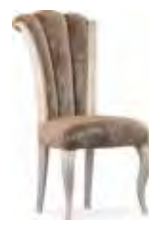
3654 SEDIA CON TESSUTO "CLG061/60" CHAIR WITH FABRIC UPHOLSTERY "CLG061/60" cm 51 x 54 x 120 h.