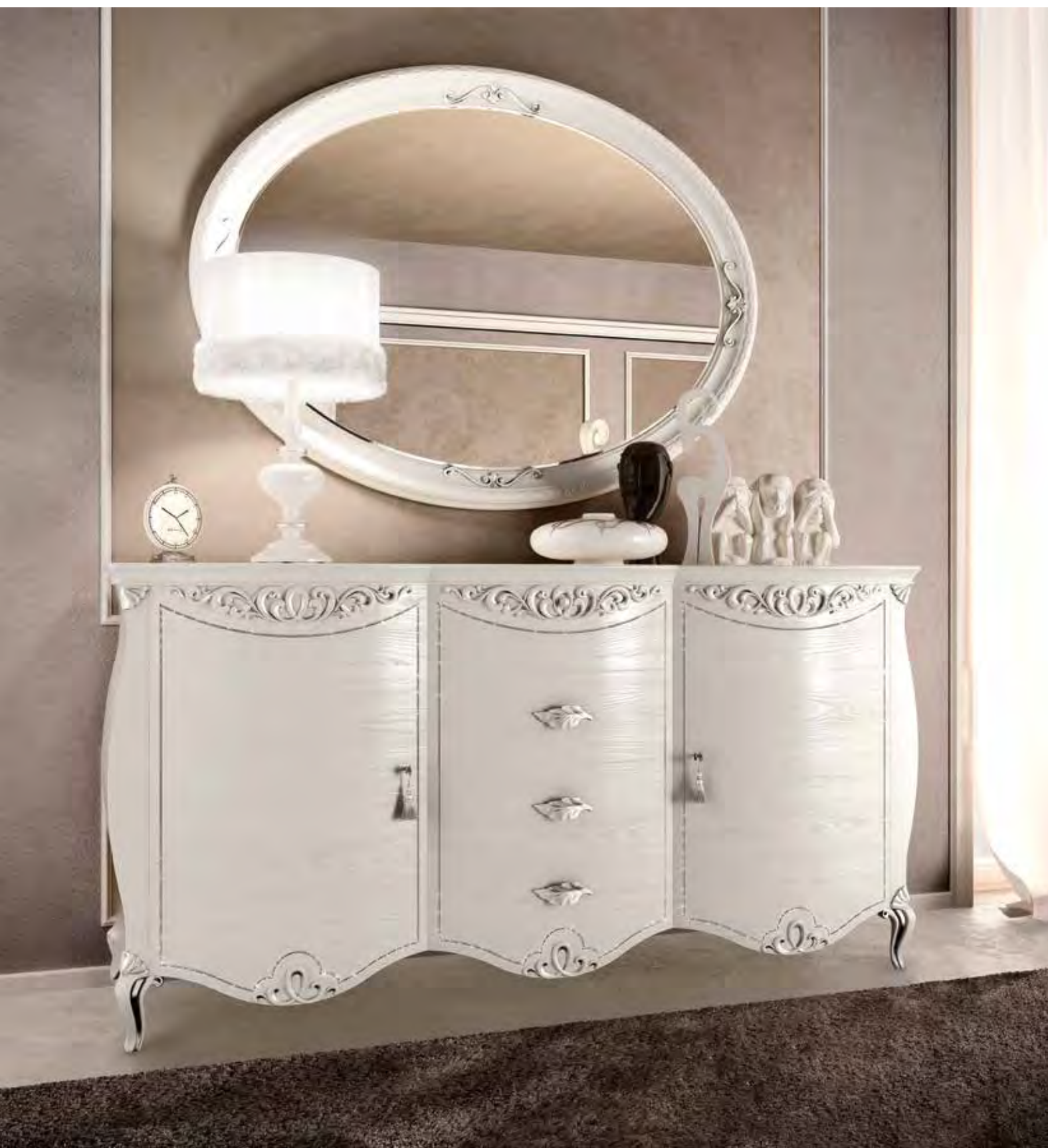
3652 CREDENZA 2 ANTE E 4 CASSETTI CENTRALI 2-DOOR SIDEBOARD WITH 4 CENTRAL DRAWERS cm 205 x 59 x 105 h.