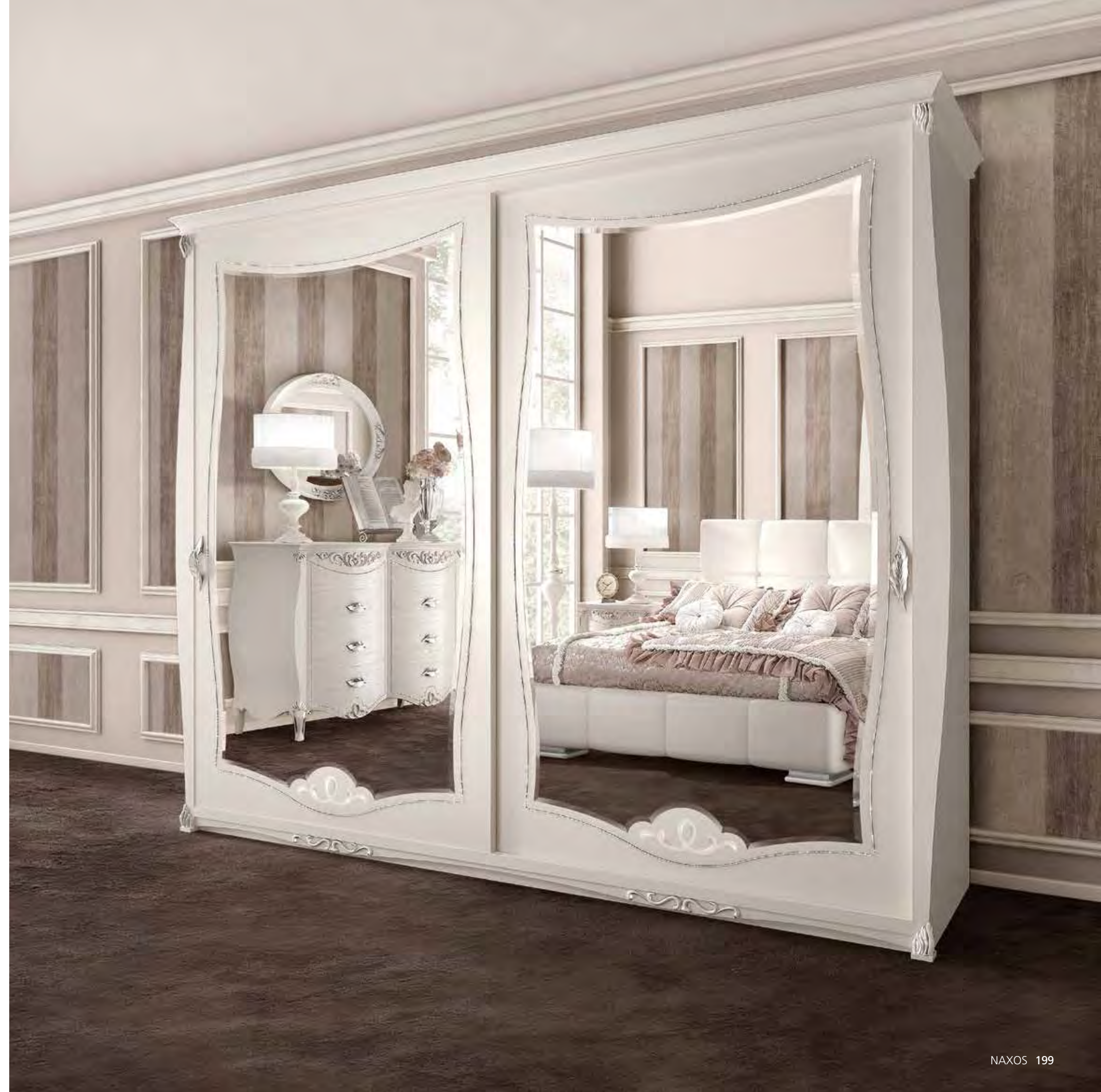
3621 ARMADIO 2 ANTE SCORREVOLI CON CASSETTIERA INTERNA SPECCHIO ESTERNO E CAPPELLO DRITTO WARDROBE WITH 2-SLIDING DOORS WITH INSIDE DRAWER UNIT, OUTSIDE MIRROR, AND STRAIGHT TOP cm 287 x 75 x 255 h.