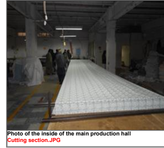
Photo of the inside of the main production hall Cutting section.JPG