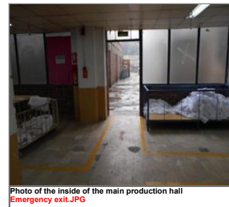
Photo of the inside of the main production hall Emergency exit.JPG