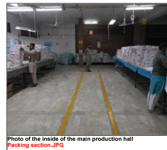
Photo of the inside of the main production hall Packing section.JPG