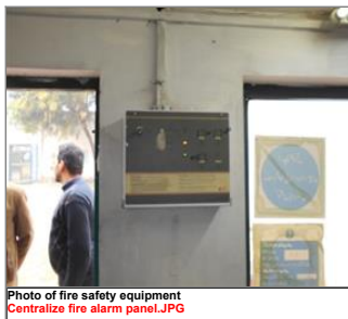
Photo of fire safety equipment Centralize fire alarm panel.JPG