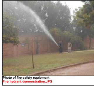
Photo of fire safety equipment Fire hydrant demonstration.JPG