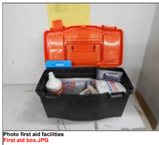
Photo first aid facilities First aid box.JPG