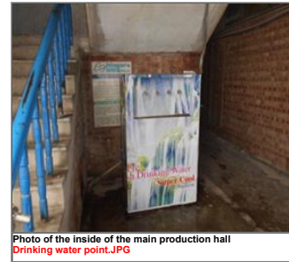
Photo of the inside of the main production hall Drinking water point.JPG