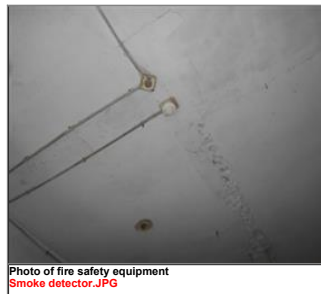
Photo of fire safety equipment Smoke detector.JPG