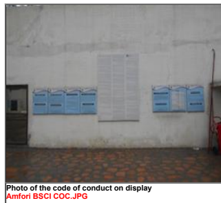
Photo of the code of conduct on display Amfori BSCI COC.JPG