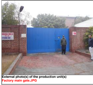
External photo(s) of the production unit(s) Factory main gate.JPG