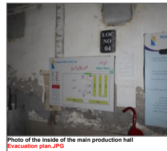
Photo of the inside of the main production hall Evacuation plan.JPG