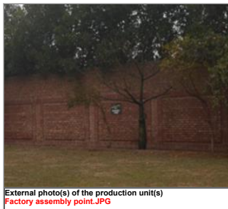
External photo(s) of the production unit(s) Factory assembly point.JPG