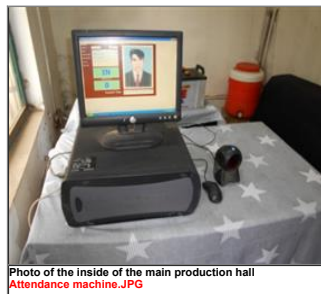
Photo of the inside of the main production hall Attendance machine.JPG